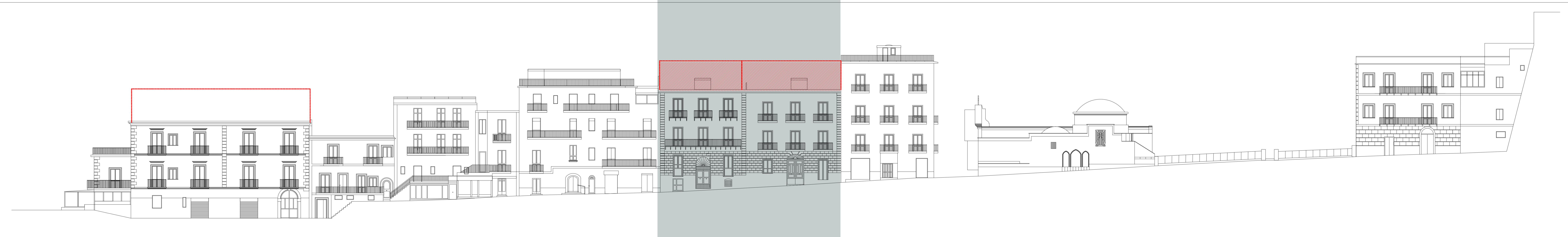
INVILUPPO DEI VOLUMI DEMOLITI E DA RICOMPORRE Via G. Matteotti - Profilo Sud