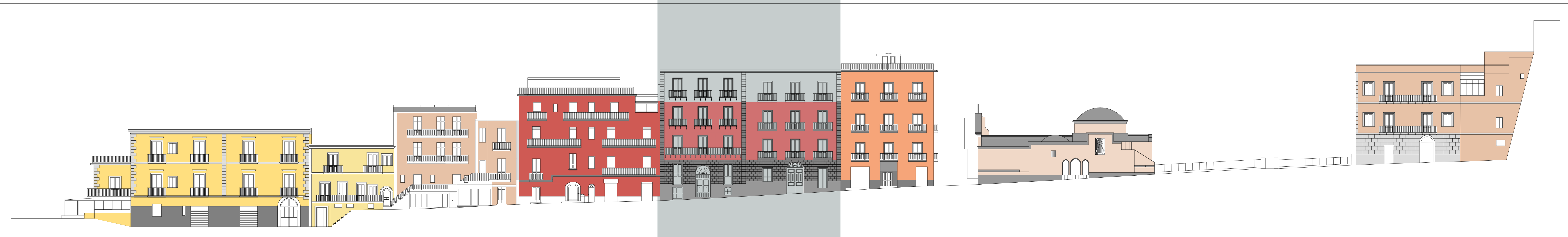
IPOTESI DI RICOMPOSIZIONE Via G. Matteotti - Profilo Sud